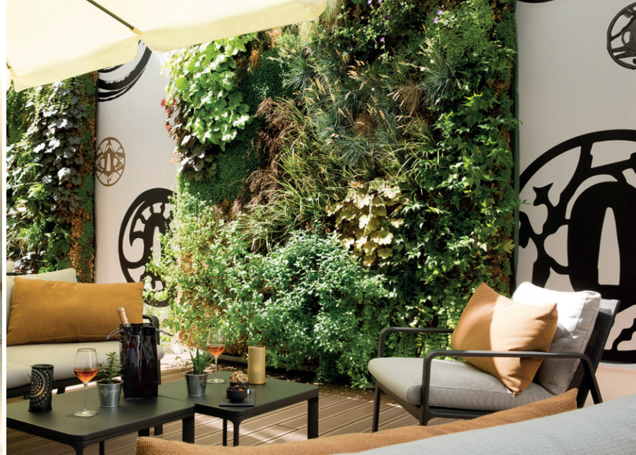
Entre chinoiseries et motifs Art déco.