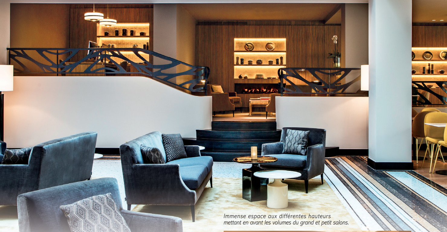
Immense espace aux différentes hauteurs mettant en avant les volumes du grand et petit salons.