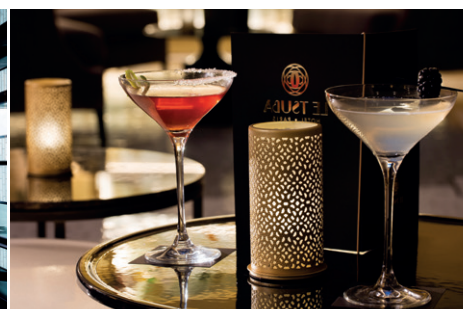
Voyage dans le temps rythmé de codes couleur, verrière architecturée et cocktails exotiques.